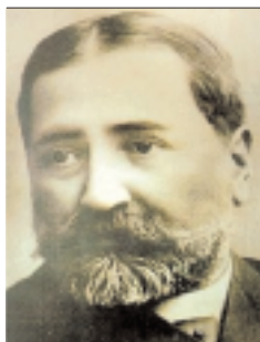
Ilia Tjvtjadze mördades år 1907. Hans motståndare var både tsarregimen i Ryssland och kommunisterna i Georgien.

Efter den ryska revolutionen 1917 utbröt strider mellan det georgiska socialdemokratiska mensjevikpartiet och bolsjevikerna. 1918 förklarades landet självständigt av mensjevikpartiet, som satt i maktställning. Mensjevikpartiet introducerade ett flerpartisystem. Självständigheten varade från 1918 till 1921