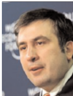
Micheil Saakasjvili , ledare för Rosenrevolutionen och Georgiens nuvarande president.

November 2003 sker Rosenrevolutionen, vilket i praktiken var ett oblodigt maktskifte till följd av omfattande valfusk i det tidigare parlamentsvalet. Maktskiftet kom efter massiva protester med tusentals människor demonstrerande på gatorna. Som ny president blev, efter nyval, Micheil Saakasjvili. Hans