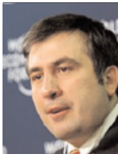
Micheil Saakasjvili , ledare för Rosenrevolutionen och Georgiens nuvarande president.

November 2003 sker Rosenrevolutionen, vilket i praktiken var ett oblodigt maktskifte till följd av omfattande valfusk i det tidigare parlamentsvalet. Maktskiftet kom efter massiva protester med tusentals människor demonstrerande på gatorna. Som ny president blev, efter nyval, Micheil Saakasjvili. Hans