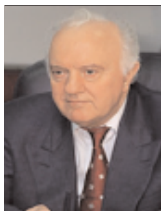
Georgiens andra president Eduard Sjevardnadze som hade bakgrund inom den politiska eliten inom Sovjetunionen. Bland annat var han sovjetisk utrikesminister mellan år 1985 och år 1990.

Några månader efter kuppen mot Gamsachurdia utses den tidigare sovjetiska utrikesministern Eduard Sjevardnadze till parlamentets talman, vilket gjorde honom till de facto president i frånvaron av en formellt vald president.