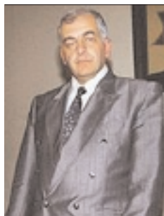
Georgiens första president Zviad Gamsachurdia.

Reformerna var få under Gamsachurdias tid som president. De ekonomiska svårigheterna bemöttes med exportförbud och priskontroller. 37 De etniska konflikterna var många, och eldades på av en nationalistisk Gamsachurdia. Nationalismen på den georgiska sidan konfronterades med den ossetiska och